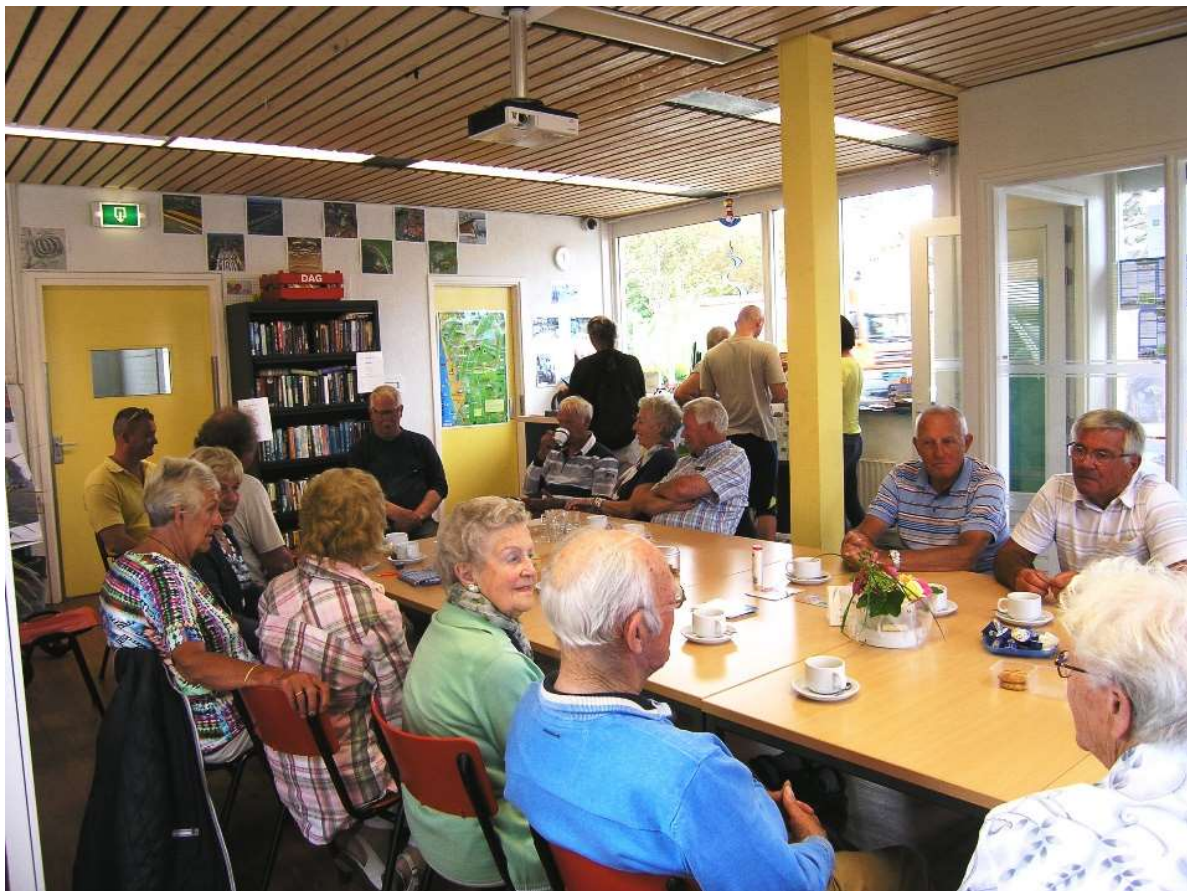
Afb. 7. DOP-bijeenkomst 5 augustus 2015, terwijl VVV-bezoekers aan de balie worden geïnformeerd wat hier allemaal mogelijk is.