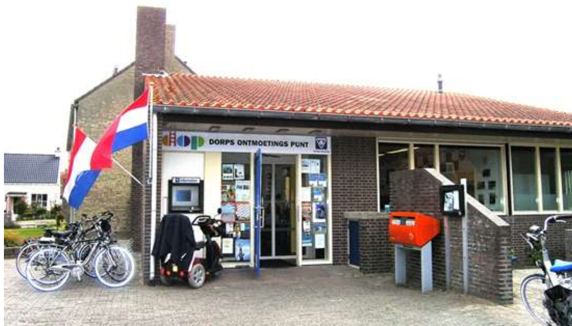
Afb. 8. Ingang Dorps Ontmoetings Punt Petten 2015

Daarnaast hebben we wederom themamiddagen georganiseerd, zie daarvoor hoofdstuk 6.