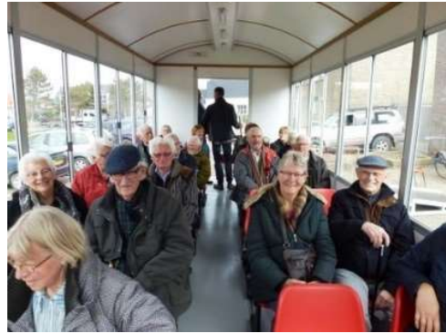
Afb. 12. Rondrit met de wagen van Tulpenland 8 april 2015

Het aantal deelnemer was gezien de capaciteit beperkt, reden waarom het bestuur vooraf een selectie moest maken. Mensen die slecht ter been waren kregen voorrang boven personen die in staat waren dit op eigen gelegenheid te bezoeken. Het was heel gemakkelijk om tweemaal met een geheel gevulde wagen deze toer te maken en de inzittenden genoten met volle teugen. Geopperd werd vanwege het grote succes dit later nog eens te herhalen.