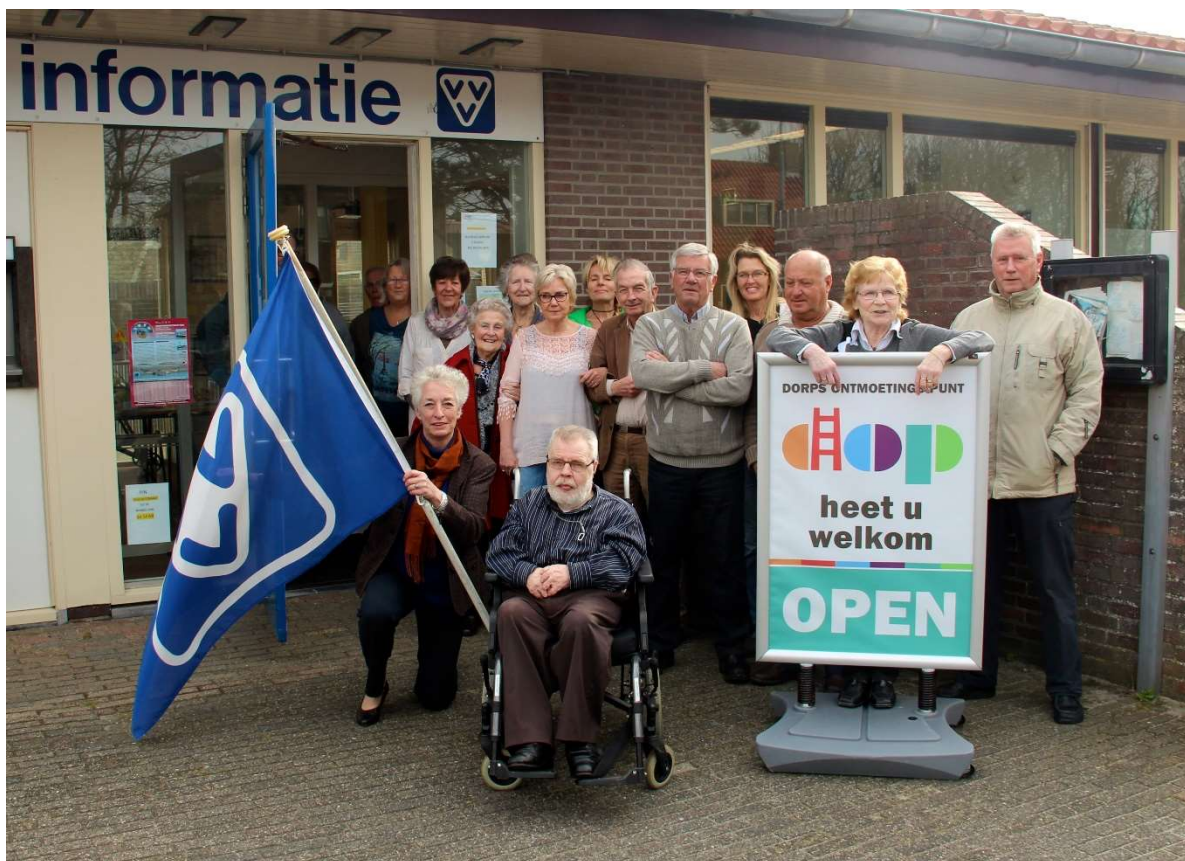
Afb. 6. Start informatieverstrekking aan VVV gasten door DOP 3 april 2015

Dit bleek na veel overleg mogelijk en werd door het bestuur van de VVV goedgekeurd. We zijn daarmee, na vooroverleg met onze vrijwilligers, vanaf 1 april van start gegaan. De VVV Kop van Holland heeft voor ons lijsten met de meest voorkomende vragen met antwoorden opgesteld. Deze werden voor ons ook in het Duits en Engels vertaald. Ook is ons het nodige foldermateriaal beschikbaar gesteld.