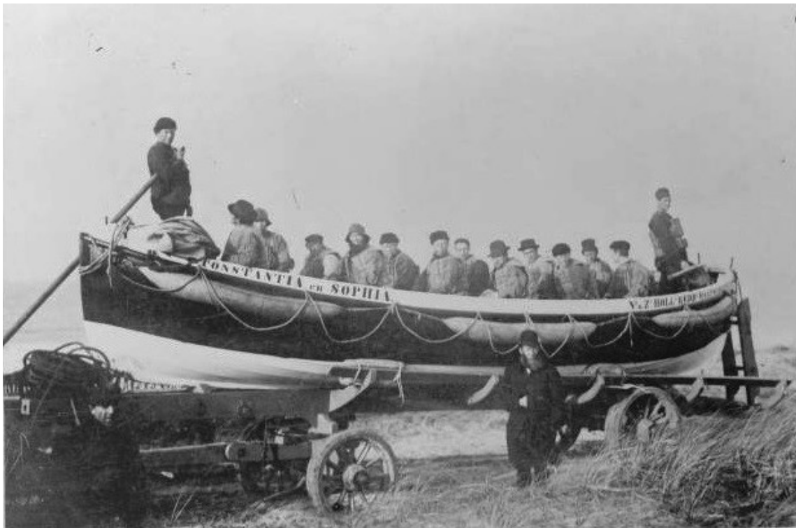
Afb. 11. Reddingsboot Petten begin 20 e eeuw