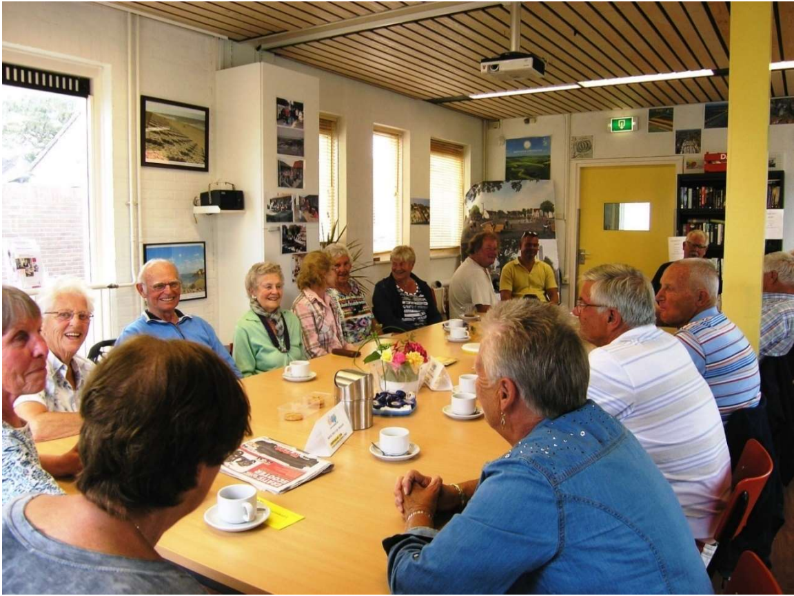
Afb. 5. DOP-bijeenkomst 5 augustus 2015