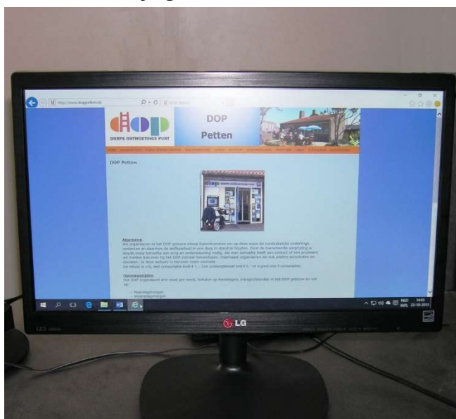
Afb. 15. Website www.doppetten.nl op het computerscherm