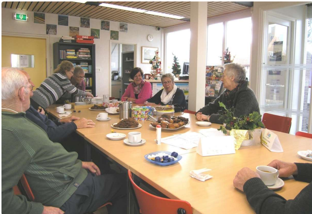
Afb. 10. Op 30 december 2015 werd de laatste DOP-bijeenkomst dat jaar stijlvol met oliebollen en appelflappen afgesloten

Diverse besturen van verenigingen waaronder de Dorpsraad Petten reserveren het DOP-gebouw voor hun bestuursvergaderingen.