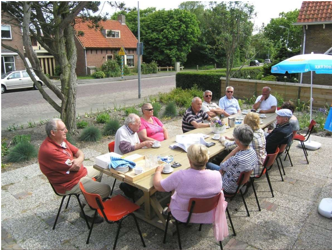
Afb. 4. Bezoekers DOP aan de terrastafel 5 juni 2015