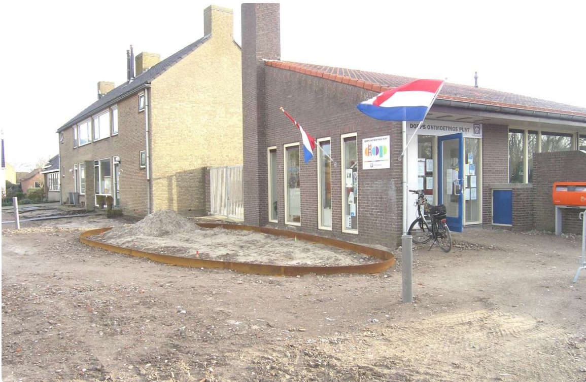
Afb. 14. Het was soms lastig, maar met een duwtje lukte het toch in het najaar en winter van 2015 binnen te komen

Onze inspanningen blijven er daarom op gericht een zo prettig mogelijk sfeer te creëren en te behouden.