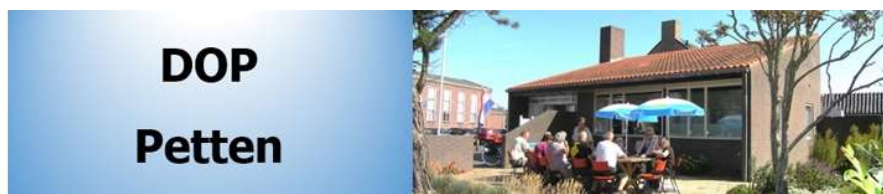
Afb. 16. Bovenbalk website www.doppetten.nl

Een praktische aanvulling is de mogelijkheid, dat iedereen het rooster van bezetting van het DOP-gebouw kan inzien. Dit is op de pagina "HUREN" ondergebracht. Wenst men een huurspraak te maken, dan kan men op de site het rooster van bezetting openen en nagaan of het tijdstip dat gewenst is nog beschikbaar is. Is dat het geval, dan kan men via het daarbij aangegeven mailadres vragen het gewenste tijdstip het DOP-gebouw vast te leggen. Na ontvangen bevestiging daarvan is de huuraanvraag vastgelegd en in het rooster opgenomen. Het DOP-gebouw zo blijkt wordt steeds intensiever gebruikt.