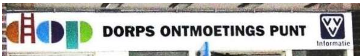
Afb. 2. Bord boven ingang DOP-gebouw 2015

Het DOP-bestuur heeft na dit besluit het VVV-gebouw geïnventariseerd en een aantal aanpassingen voorgesteld om dit gebouw geschikt te maken voor activiteiten van het DOP en mogelijk ook voor derden. We hebben deze wensen met het bestuur van SEBAP besproken. Daarbij is afgesproken, dat zoals al gebruikelijk, het DOP de verhuur van het gebouw blijft verzorgen en aan SEBAP maandelijks de huurkosten doorgeeft. SEBAP stuurt op basis daarvan de rekeningen aan de huurders. In dat overleg heeft het bestuur van SEBAP aangeboden de kosten van een groot aantal van de voorgestelde aanpassingen voor hun rekening te willen nemen en opdracht voor de uitvoering te verlenen. Dit is door ons bestuur in dank aanvaard.