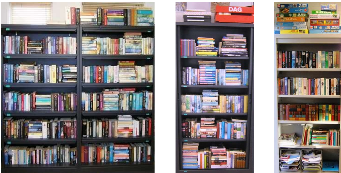
Afb. 9. Boekenkasten in het DOP voor vrije uitleen december 2015

Daarop ontstond spontaan het inzamelen van boeken van inwoners die hun boeken ook wel voor anderen beschikbaar wilden stellen. Dit leverde vrij snel een prachtig boekenbestand op waar onze bezoekers vrij boeken kunnen meenemen met het verzoek ze na lezing terug te brengen. De dames Ella Dammers, Cathrien Blekendaal en Ineke Evertsz verzorgen deze boekenkasten en moesten zelfs na enige maanden een leverstop afroepen, omdat we het aanbod niet meer konden opbergen.